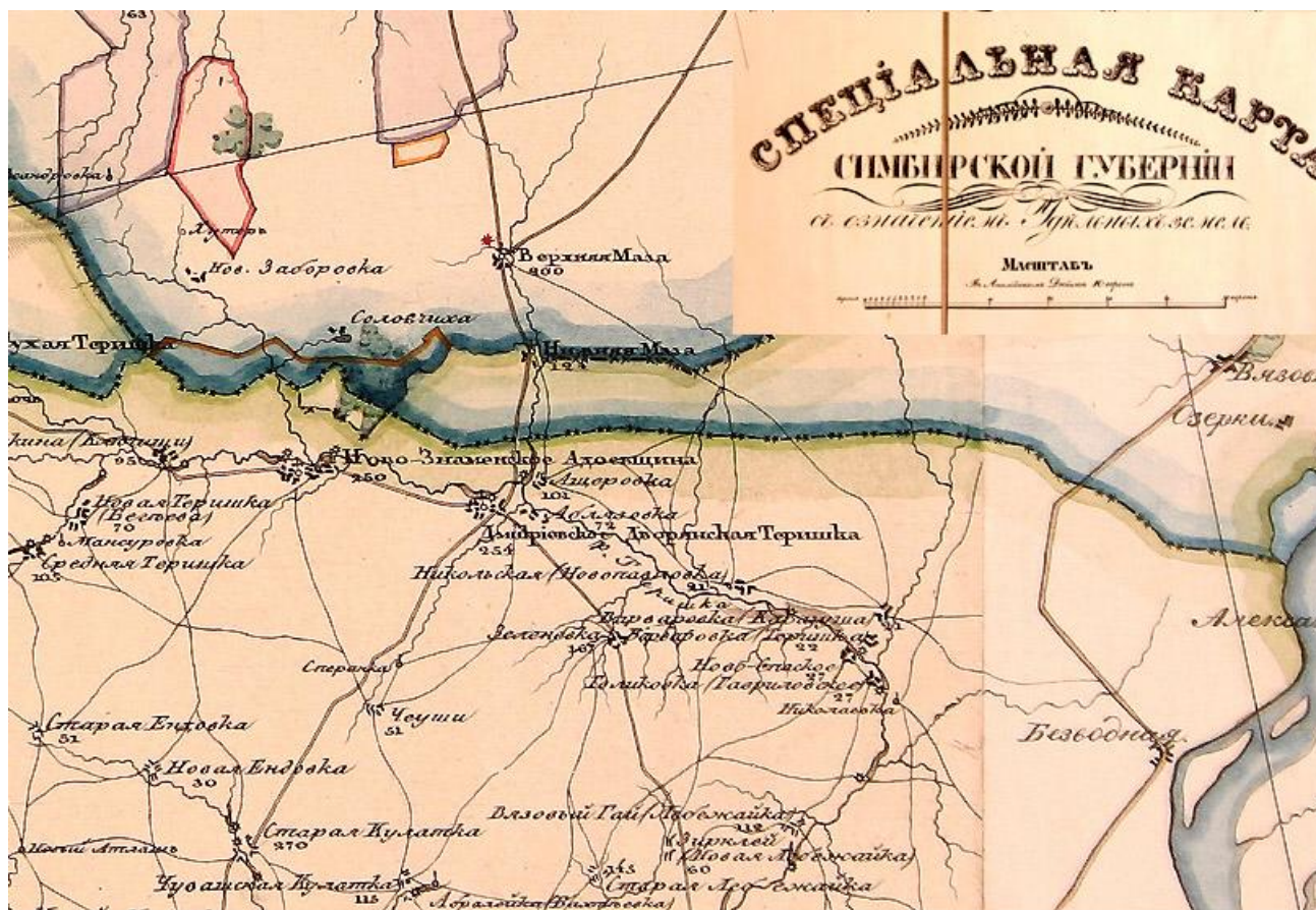
Карта местности 19-го века

Федеральное архивное агентство. Архив девних актов (РГАДА) Директор архива: М. Р. Рыженков, Исполнитель Тарасова 580-8755 26.01.2009.