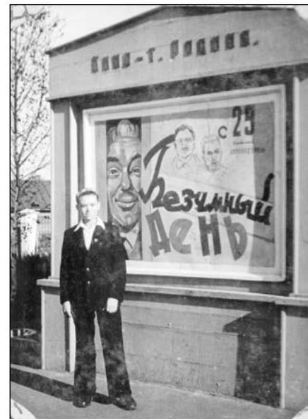
Афиша кинотеатра «Родина». 1950-е гг.