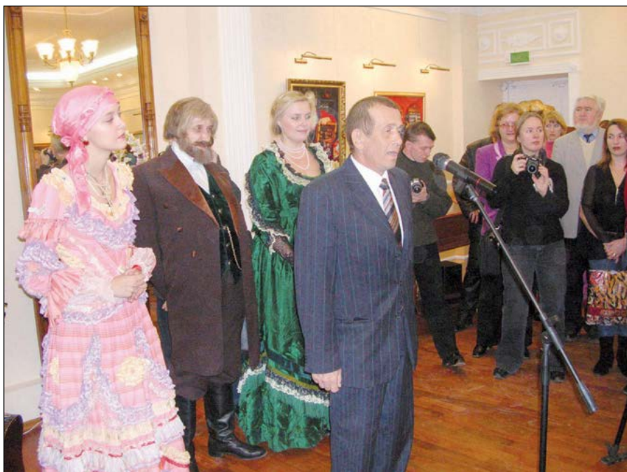
Открытие музея «Симбирское купечество». 14 декабря 2006 г.