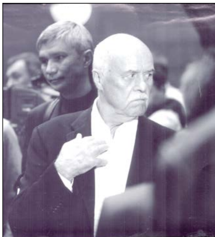
Режиссер С. Говорухин во время Фестиваля «От всей души» им. В. Леонтьевой. г. Ульяновск, 2011 г.