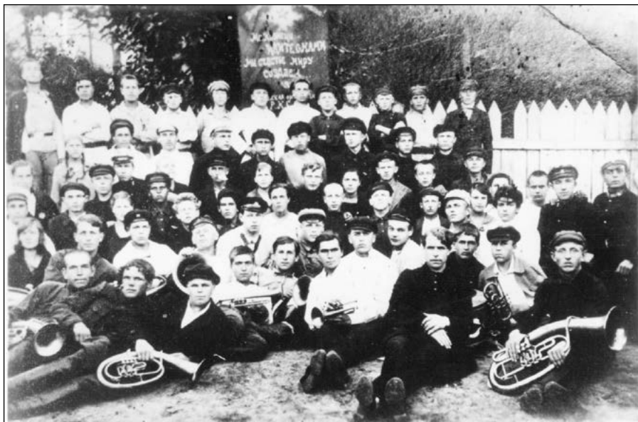
Музыканты духового оркестра Народного дома ст. Инза. 1923 г.