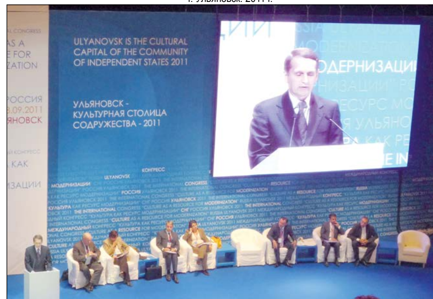
1 Международный культурный форум «Культура как ресурс модернизации». Пленарное заседание. г. Ульяновск, 2011 г.