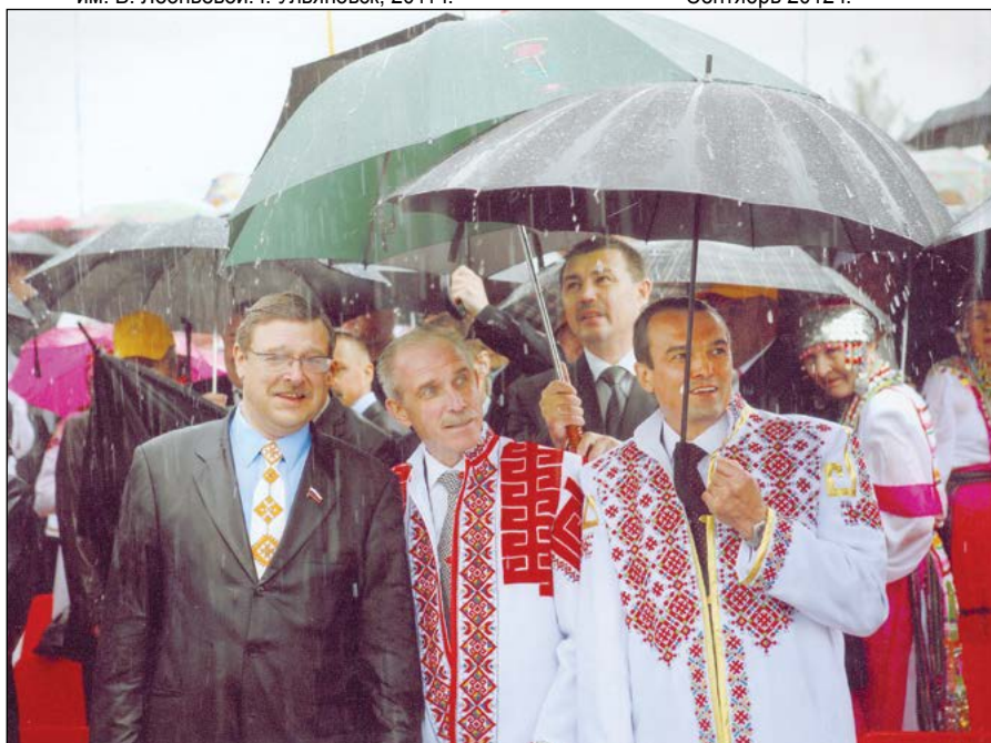
Акатуй – 2011