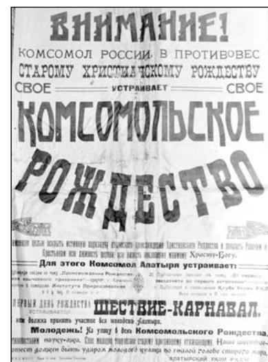
«Комсомольское Рождество». Афиша.