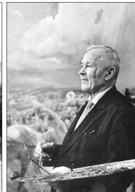
Народный художник СССР А.А. Пластов.