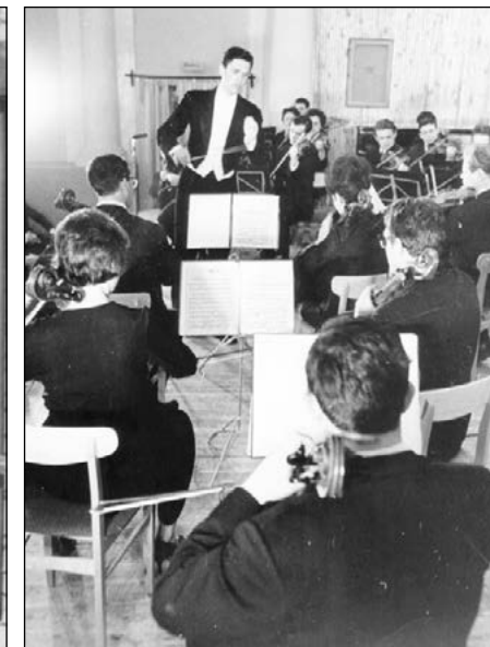
Репетиция Ульяновского государственного симфонического оркестра. 1960-е гг.