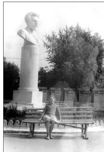
Памятник Я.М. Свердлову в парке им. Я.М. Свердлова в г. Ульяновск. 1962 г.