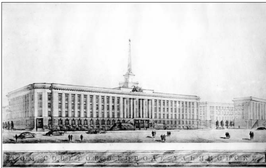
Проект Дома Советов в г. Ульяновске. 1949 г.