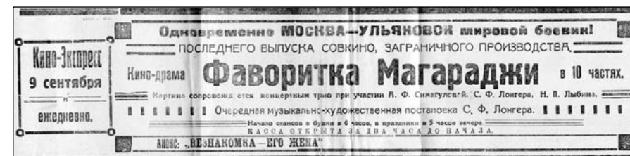
Афиша фильма. 1926 г.