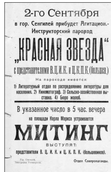
Афиша митинга. 2 сентября 1919 г.

Ж. Трофимов. Страницы истории Симбирского театра. 1917 – 1922 гг. Ульяновск. «Красная летопись». Симбирск, 1923 г. «Ленин и Симбирск». Ульяновск, 1970 г. «Ульяновская область за годы 10-й пятилетки». Сборник. 1980 г. «Народное хозяйство Ульяновской области за два года 11-й пятилетки». Сборник. 1985 г.