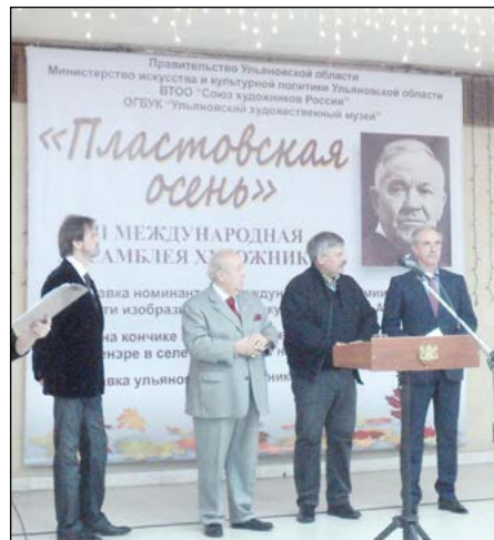
Открытие Международной ассамблеи художников «Пластовская осень». Сентябрь 2012 г.