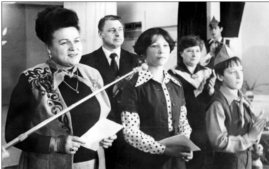
Народная артистка СССР Людмила Зыкина во время посещения Ульяновского Дворца пионеров. 1970-е гг.